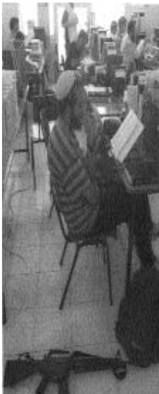
έποικος εν ώρα μαθήματος...

Το κράτος του Ισραήλ από την πρώτη στιγμή συγκροτήθηκε σε μια милитарιστική βάση, καθώς η επιβίωσή και η διατήρησή του βασίστηκε στη στρατιωτική του επιβολή στους αραβικούς πληθυσμούς, που διέμεναν ή γειτνιάζαν με τα εδάφη, τα οποία του δόθηκαν το 1947 από τον Ο.Η.Ε.. Αυτού του τύπου ο милитарισμός, που καθόρισε κάθε πτυχή της κοινωνικής ζωής, (είναι χαρακτηριστικό ότι οι μεν άντρες υπηρετούν στην ηλικία των 18 τρίχρονη στρατιωτική θητεία, ενώ μέχρι τα 52 τους παρουσιάζονται ένα μήνα το χρόνο για μετεκπαίδευση, οι δε γυναίκες είναι υποχρεωμένες να υπηρετούν εικοσάμηνη στρατιωτική θητεία) σε συνδυασμό με τα σιωνιστικά ιδεώδη συντέλεσαν στη δημιουργία μιας ακραία συντηρητικής κοινωνίας. Μιας κοινωνίας που ταυτίζεται σε μεγάλο βαθμό με τις επιδιώξεις και τους σχεδιασμούς της ντόπιας εξουσίας.