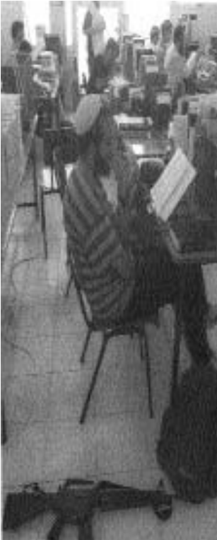
έποικος εν ώρα μαθήματος...

Το κράτος του Ισραήλ από την πρώτη στιγμή συγκροτήθηκε σε μια милитарιστική βάση, καθώς η επιβίωσή και η διατήρησή του βασίστηκε στη στρατιωτική του επιβολή στους αραβικούς πληθυσμούς, που διέμεναν ή γειτνιάζαν με τα εδάφη, τα οποία του δόθηκαν το 1947 από τον Ο.Η.Ε.. Αυτού του τύπου ο милитарισμός, που καθόρισε κάθε πτυχή της κοινωνικής ζωής, (είναι χαρακτηριστικό ότι οι μεν άντρες υπηρετούν στην ηλικία των 18 τρίχρονη στρατιωτική θητεία, ενώ μέχρι τα 52 τους παρουσιάζονται ένα μήνα το χρόνο για μετεκπαίδευση, οι δε γυναίκες είναι υποχρεωμένες να υπηρετούν εικοσάμηνη στρατιωτική θητεία) σε συνδυασμό με τα σιωνιστικά ιδεώδη συντέλεσαν στη δημιουργία μιας ακραία συντηρητικής κοινωνίας. Μιας κοινωνίας που ταυτίζεται σε μεγάλο βαθμό με τις επιδιώξεις και τους σχεδιασμούς της ντόπιας εξουσίας.