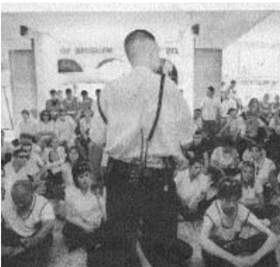
ισραηλινός αστυνομικός διδάσκει σε νέους την αντιμετώπιση των καμικάζι

Επίσης, αρνήσεις στρατιωτών να υπηρετήσουν στα κατεχόμενα από το '67 εδάφη (το 1972 εμφανίζονται οι πρώτοι επιλεκτικοί αρνητές, ο Yossi Kotten και ο Yitzak Laor, ενώ ως τα τέλη του 2002 περίπου 1200 ισραηλινοί έχουν δηλώσει πρόθεση άρνησης, 500 έχουν ήδη αρνηθεί, ενώ πάνω από 200 έχουν εκτίσει ποινές φυλάκισης για την απόφασή τους να μην υπηρετήσουν στα παλαιστινιακά εδάφη), ολικές αρνήσεις στράτευσης τα τελευταία χρόνια, άνοιγμα κλειστών εισόδων του τείχους, κοινά κάμπινγκ Ισραηλινών και Παλαιστινίων κ.α.