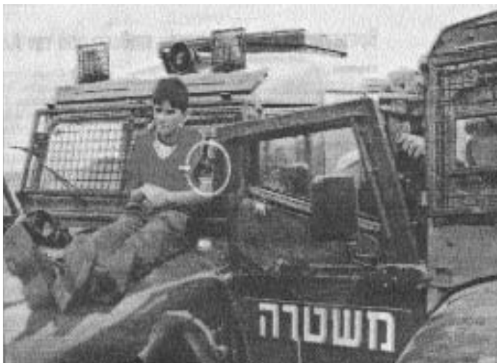
ισραηλινοί στρατιώτες χρησιμοποιούν νεαρό παλαιστίνιο ως ασπίδα προστασίας...

στιγματίστηκαν ως προδότες και υπέστησαν εξευτελισμούς. Η ένταση των αντιδράσεων αυτών έχει μειωθεί τον τελευταίο καιρό κι αυτό οφείλεται, τόσο στη διάρκεια και στην άνοδο τέτοιων κινήσεων αντίστασης, όσο και στο αδιέξοδο, στο οποίο έχουν οδηγήσει οι πολιτικές του ισραηλινού κράτους. Έτσι, παρά την έντονη προπαγάνδα των ισραηλινών ΜΜΕ, που χρησιμοποιώντας τις επιθέσεις αυτοκτονίας προσπαθούν να πείσουν για την ορθότητα των κρατικών σχεδιασμών και επιλογών, οι οποίες σπέρνουν το θάνατο, παρατηρούμε μια σταδιακή αλλαγή στις αντιλήψεις της ισραηλινής κοινωνίας.